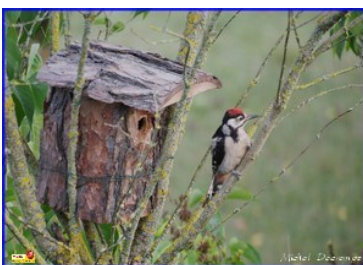
Pic Epeiche juvénile En février, à vos nichoirs...

« Dans tous les cas, régularité et ponctualité sont les maîtres mots ».